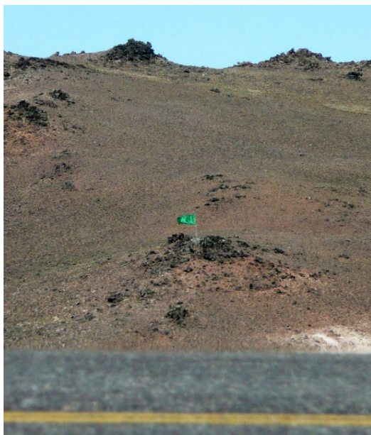
Fotos del cerro, sobre ruta 40, que corre riesgo de ser volado por la minería a cielo abierto.