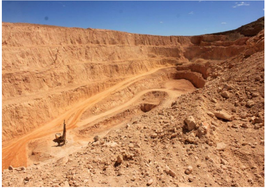
Fotos de la actual mina de Patagonia Gold, Lomada de Leiva, a menos de 2 km del sitio arqueológico El Feo y 10 km de la zona de exploración actual.