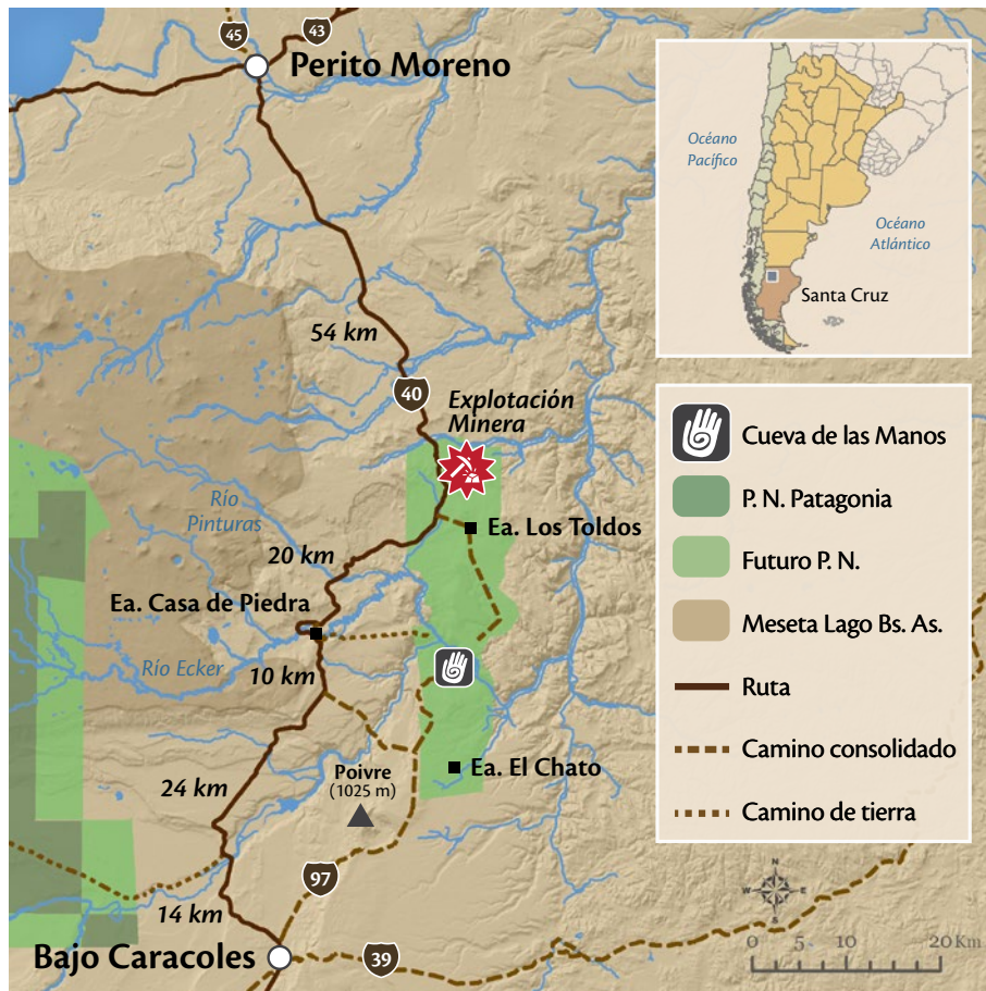
Mapa de la Estancia Cueva de las Manos, ofrecida en donación a Parques Nacionales. Ubicación de la zona de exploración, de la traza de la ruta 40 y el sitio Cueva de las manos.

La Fundación Flora y Fauna Argentina reconoce que es el Municipio de Perito Moreno, la provincia de Santa Cruz y la Nación quienes deben delinear y definir la mejor solución en el largo plazo, de nuestra parte sólo podemos ofrecer las tierras en donación para el bien común y el disfrute de los valores extraordinarios a las generaciones futuras.